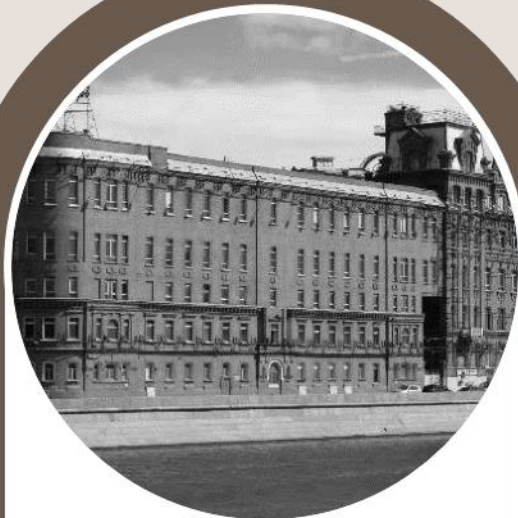
1851 - Фабрика «Красный Октябрь» ( товарищество «Эйнем» )