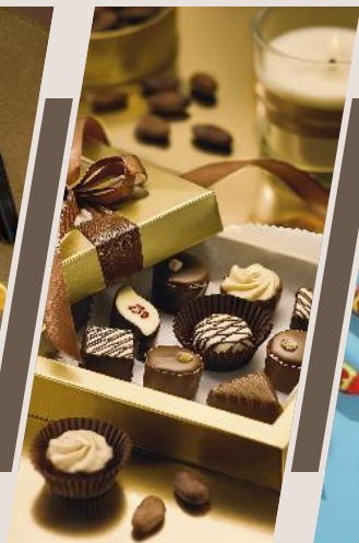
КОНФЕТЫ В КОРОБКАХ