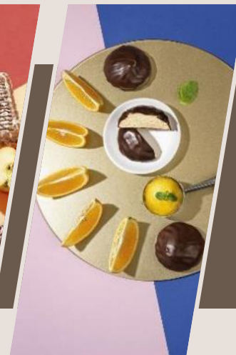
САХАРИСТЫЕ И ПРОЧИЕ